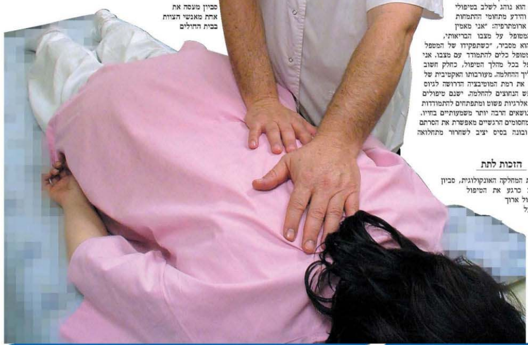
סביון מעסה את אחת מאנשי הצוות בבית החולים